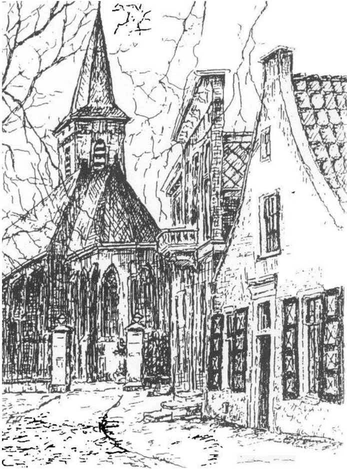
Dorpskerk Wassenaar 5 mei 2019