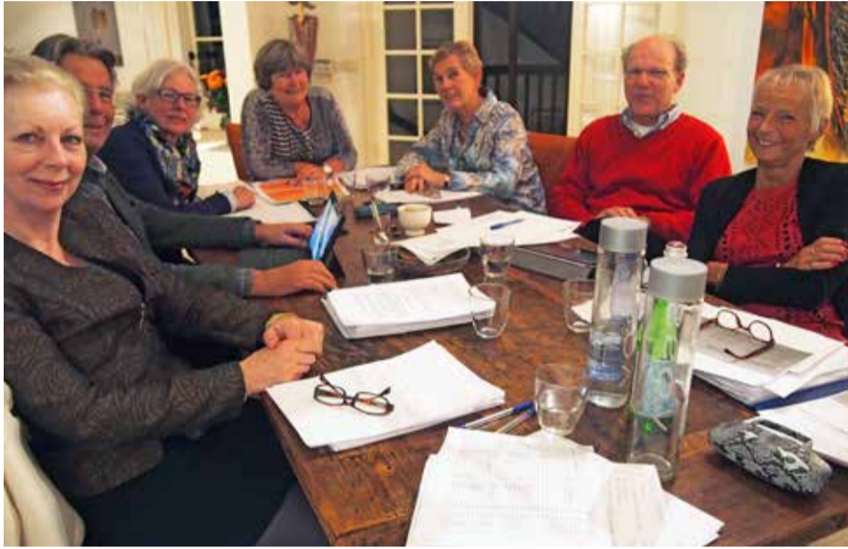
De commissie Toekomst PGW

Dat klinkt nog niet heel revolutionair. “Revolutie zet de boel op z'n kop en creëert chaos. Ons gaat het om vernieuwing. En vernieuwing gaat stapsgewijs. De grootste verandering wordt dat de