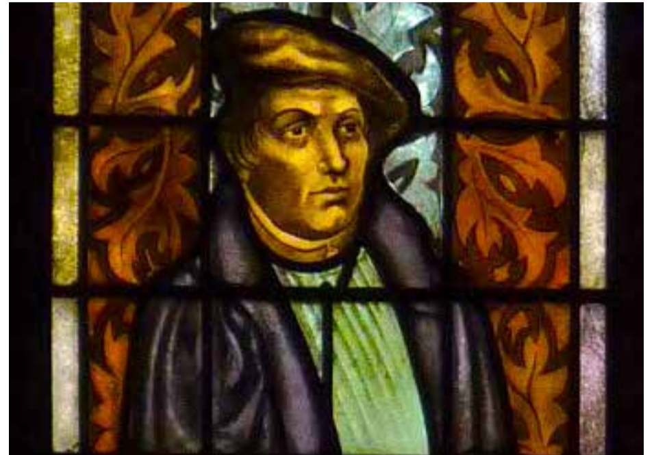
Detail Engelenraam in de Dorpskerk van Wassenaar

Al deze aandacht is terecht, want Luther heeft voor enorme veranderingen in de kerk en de samenleving van West-Europa gezorgd. In de aanloop naar het Lutherjaar werd recentelijk ook aandacht gevraagd voor een minder fraaie kant van hem: zijn uitspraken over Joden in Over de Joden en hun leugens (1543). Luther roept daarin op om synagogen in brand te steken, huizen van Joden af te breken en hen op te pakken en naar werkkampen te sturen. Ik schrijf dit op 4 mei van dit jaar, de dag waarop we de slachtoffers