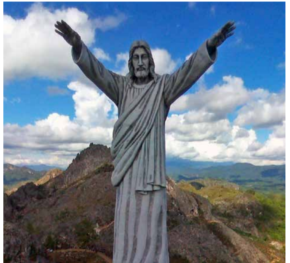
Jezus-beeld in Tana Toraja

In Mamasa, acht uur rijden van Makassar, lijkt minder veranderd. Tijdloze groene sawahs met modderende waterbuffels omgeven het stadje. De adat (traditionele cultuur) is hier nog sterk. Ons bezoek valt samen met de synodevergadering van de kerk. Ik kom er niet onderuit een Bijbelstudie te leiden. Ik stel een vraag, iemand wil reageren, maar ik word aan mijn mouw getrokken. Een man links van mij wil wat zeggen. Hij is, zo blijkt, oud-synodevoorzitter en van hoge komaf. Ondenkbaar dat hij niet als eerste het woord zou krijgen.