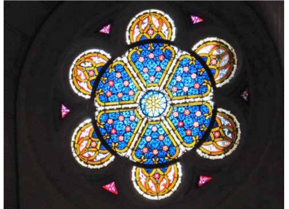
Ker kraam in de slotkapel te Wittenberg

Het vierde eeuwfeest in 1917 was het begin van een rampzalige ontwikkeling in de Duitse geschiedenis. Hoewel de festiviteiten in 1917 vanwege de oorlog met Engeland en Frankrijk beperkt bleven tot lokale herdenkingen, werd het politieke gedachtegoed van Luther in de pers en aan de universiteiten breed uitgemeten. Zo werden in die tijd de antisemitische