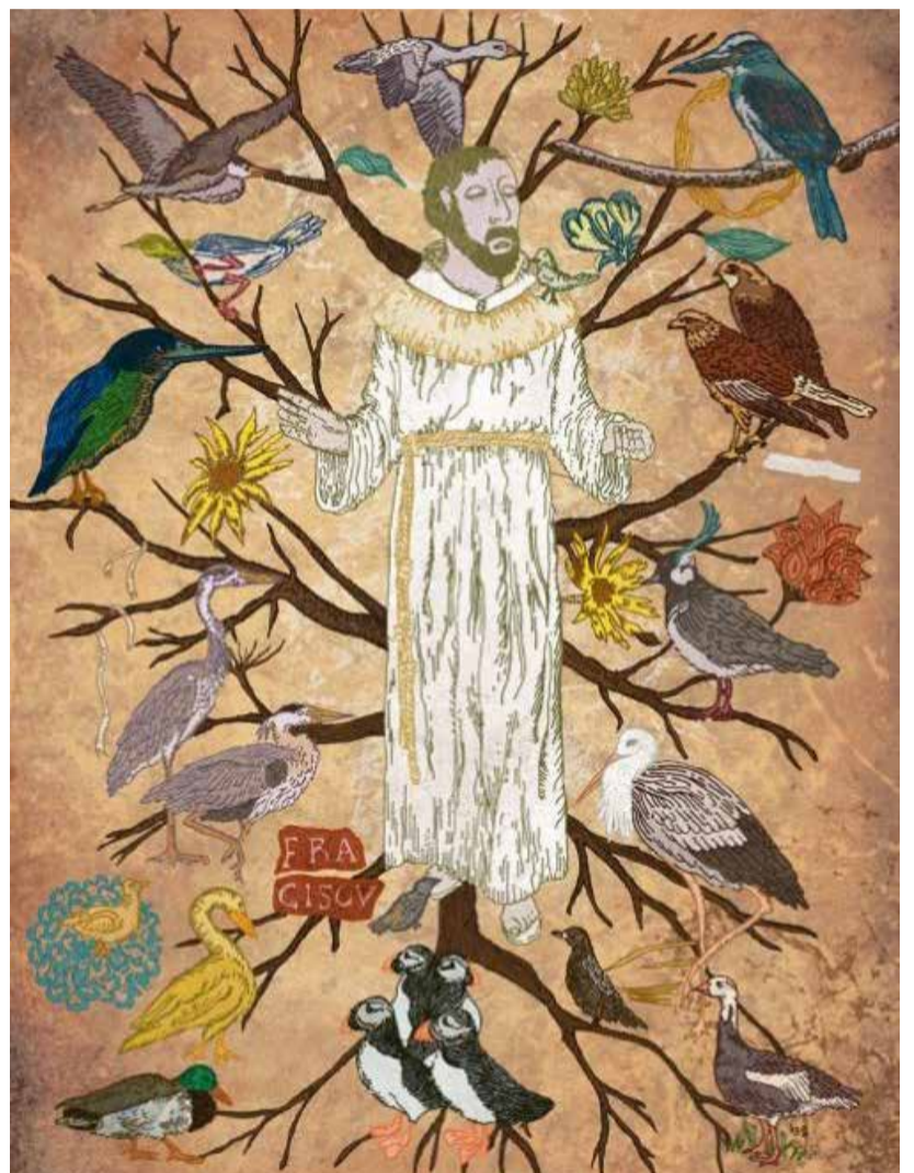
Franciscus van Assisi, patroonheilige van de dieren

Wie de levensgeschiedenis van Franciscus kent, herinnert zich ongetwijfeld het verhaal over zijn bekering. Als koopmanszoon leidde hij een luxe en losbandig leven. Zijn ouders hadden hem bij zijn geboorte de naam Johannes gegeven, maar zijn vele reizen naar het toen nogal wufte Frankrijk gaven hem de bijnaam de Fransoos (Franciscus). Hij ambieerde het ridderschap en leefde feitelijk