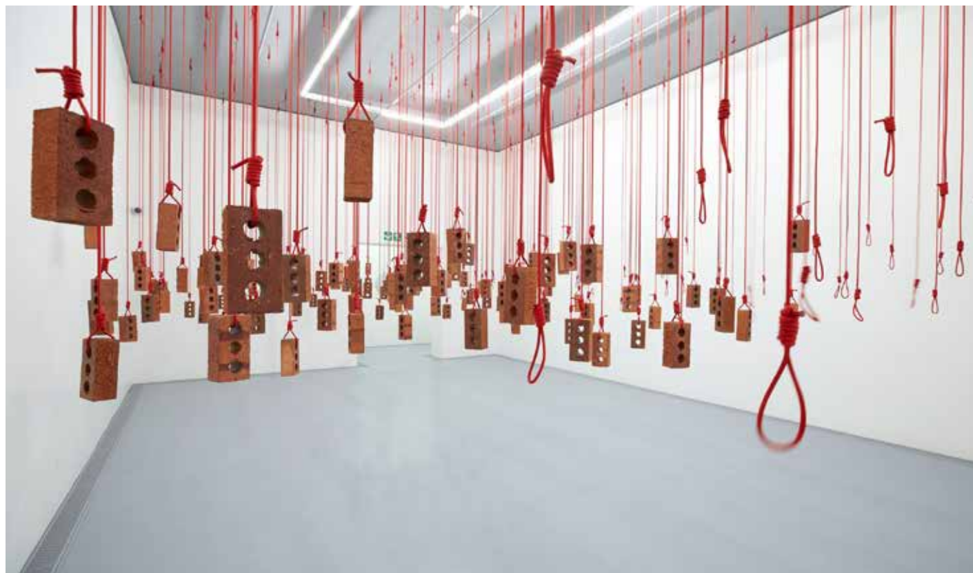
Kendell Geers: Hanging piece

De ochtendstilte in de studeerkamer wordt verstoord. Iemand belt me met een vraag over verzoening. Ik kom in een fractie van een seconde, sneller dan ik denken kan, in verzet. Uren later stel ik mezelf de vraag: die diepe verontwaardiging, omwille van wie stond die in me op?