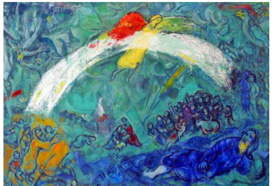
Marc Chagall: Noach en de regenboog