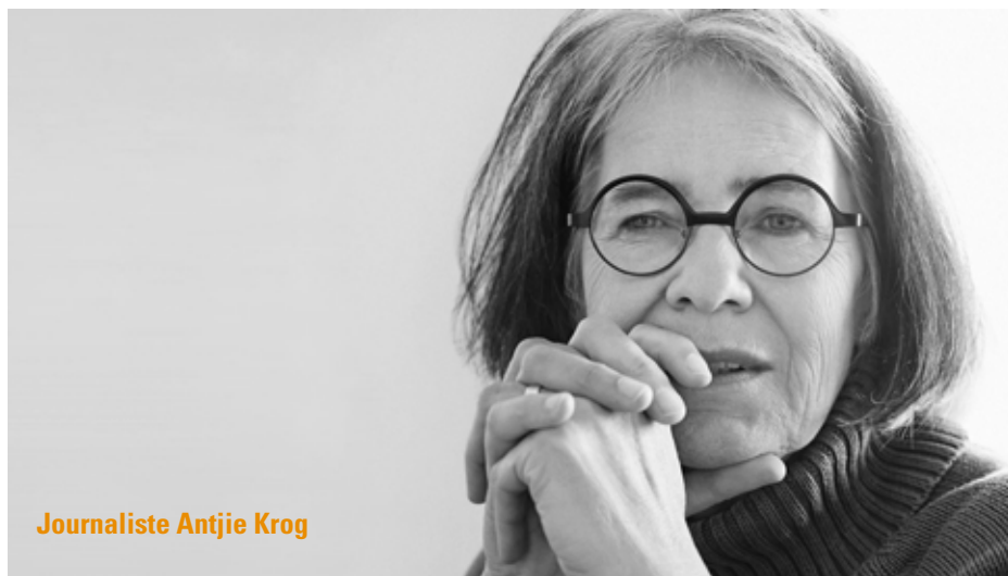
Journaliste Antjie Krog