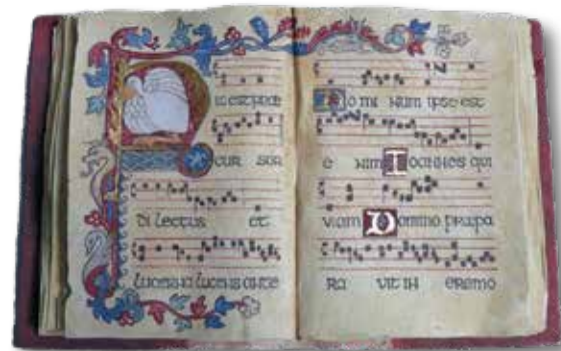
Liber generationes van Luyt de Brauw, uitgevoerd in keramiek

Wini: "Ik denk het niet. De verbondenheid met het kerkgebouw is sterk. De verbinding tussen kerkgebouw en één vaste predikant verdwijnt. Maar de band met de plek waar je de diensten viert, blijft voor veel mensen."