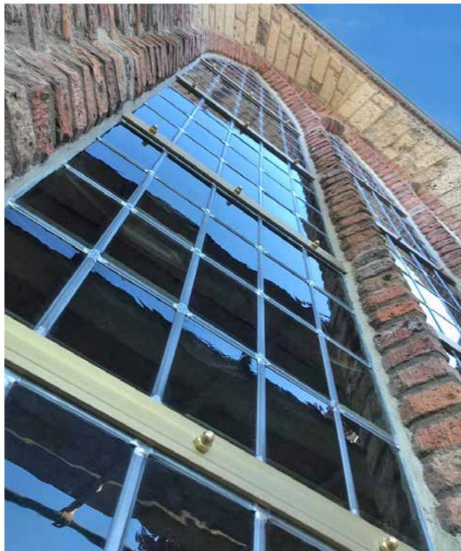
Eén van de vernieuwde ramen van de Dorpskerk

De werkzaamheden begonnen met een kennismakingsgesprek, het offertetraject