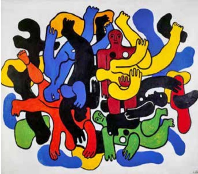
'La danse' uit 1929 van Fernand Léger