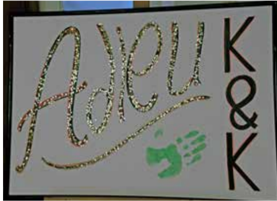
Kerk en Kunst-special met mosgroen stempel