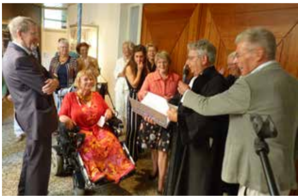
Aanbieding van het Liber Amicorum met persoonlijke teksten van vele gemeenteleden