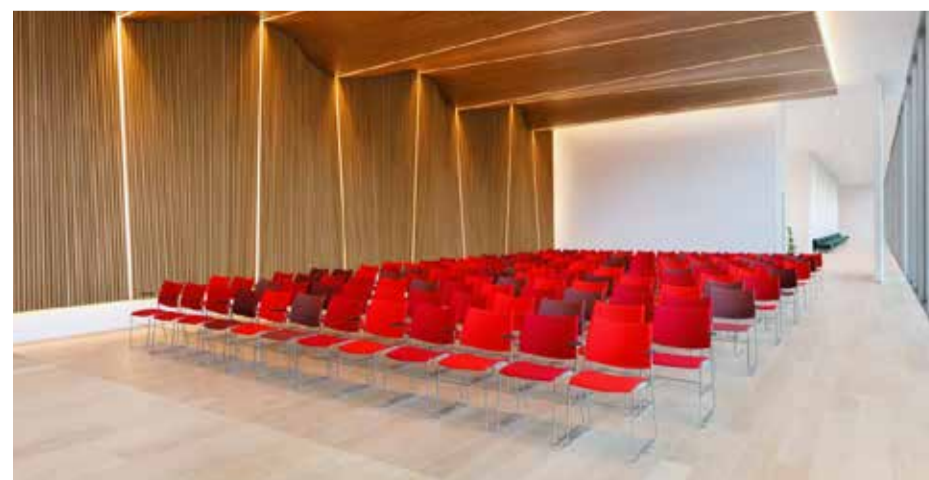
De Messiaskerk krijgt dezelfde stoelen als Museum Voorlinden, maar dan in het zwart

Om deze redenen heeft de wijkbeheerraad besloten 124 stoelen aan te schaffen (de helft van de voorgenomen 250). Deze worden naar verwachting in oktober geleverd. De koop is volledig gedekt door de twee erfenissen en maakt deel uit van de goedgekeurde begroting van 2020. Als de coronamaatregelen versoepeld worden, wordt gekeken of de overige 126 stoelen ook kunnen worden aangeschaft. Dit zal ook afhankelijk zijn van de bijdrage van onze leden. ■