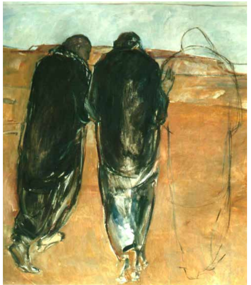
Emmaüsgangers: Metgezel in Zingeving

Jezus is aan mij niet verschenen. Tenminste niet op die manier. Maar de ervaring dat de verschijning van een onbekende, die even met je oploopt en dan weer verdwijnt, je tot leven wekt en je geloof versterkt, ken ik wel. Ik denk nu aan de ontmoetingen met Iraanse vluchtelingen in de afgelopen weken. Zij komen uit een mij onbekende wereld. Wat ze hebben meegemaakt en beleefd, weet ik niet precies. Ze doken op in Duinrell, we