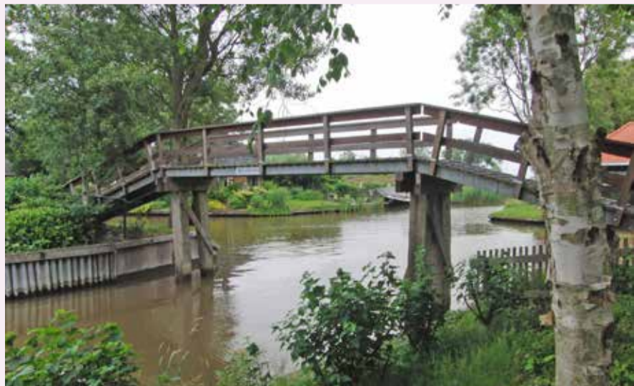
Het beroemde bruggetje van Bartlehiem

Vanmiddag (lang reeds was hij heen gespoed) Heb ik in 't stempelhok de Dooi ontmoet. 'Waarom', zo vraag ik, wijl het water stijgt, 'Hebt gij vanmorgen reeds de tocht bedreigd?' Glimlachend antwoordt hij: 'Geen dreiging was 't, Waarvoor uw rijder vlood. Ik was verrast, Toen ik vanmorgen in uw hokje heb gezien Die ik des avonds halen moest in Bartlehiem.' ■