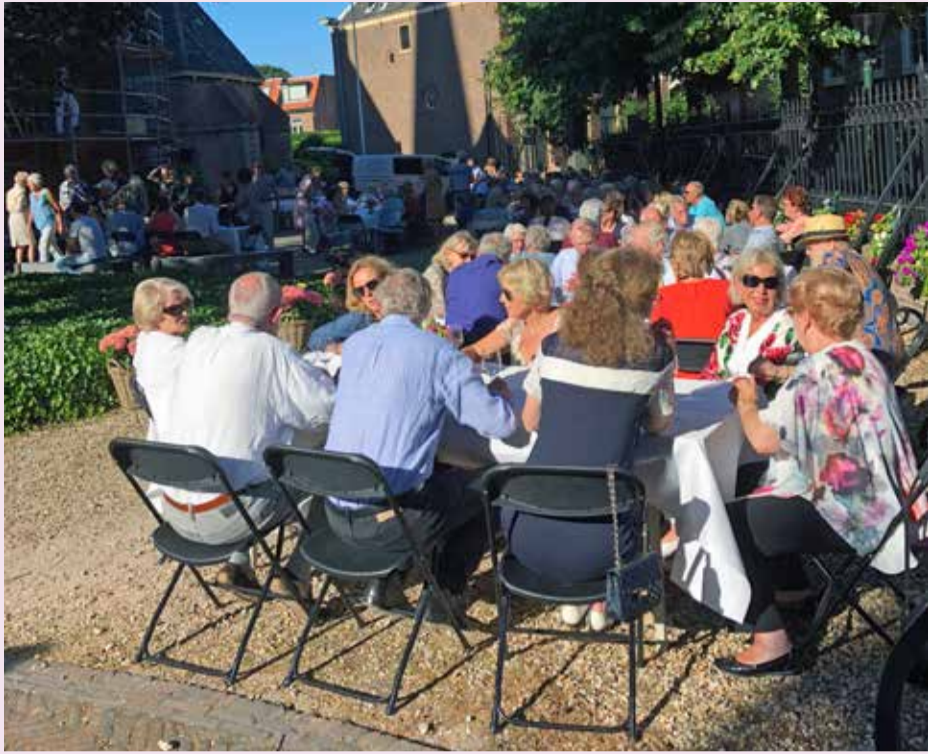
Samen eten beantwoordt aan het doel om de samenleving de kerk binnen te halen