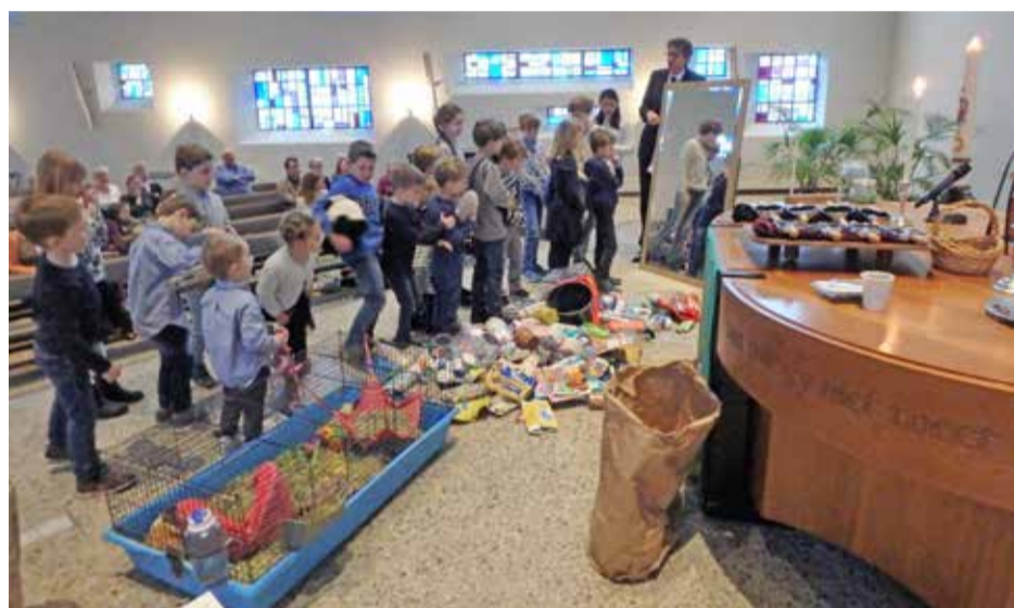
Kids Church in de Messiaskerk

En dan gaan we eens kijken of we naast de beginnetjes en de goedlopende zaken ook weer nieuwe initiatieven kunnen bedenken. Kindercatechese. Kliederkerk.